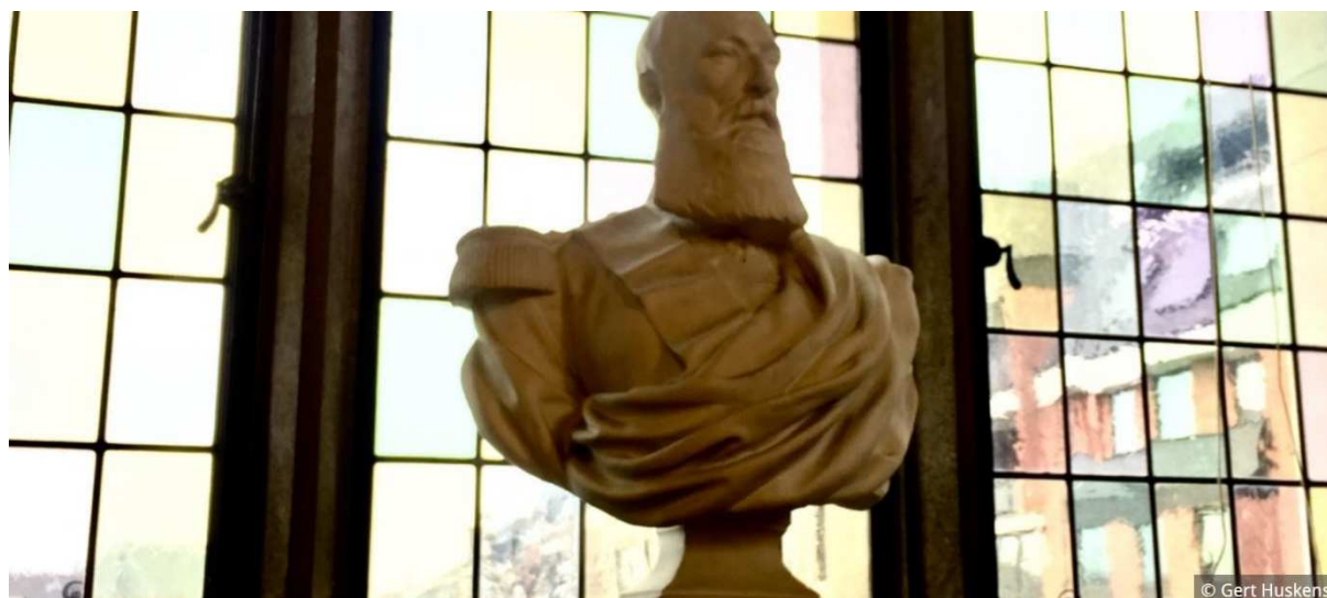
Ill. 4. Het borstbeeld van Leopold II dat in juni 2020 verwijderd werd uit de Leuvense universiteitsbibliotheek