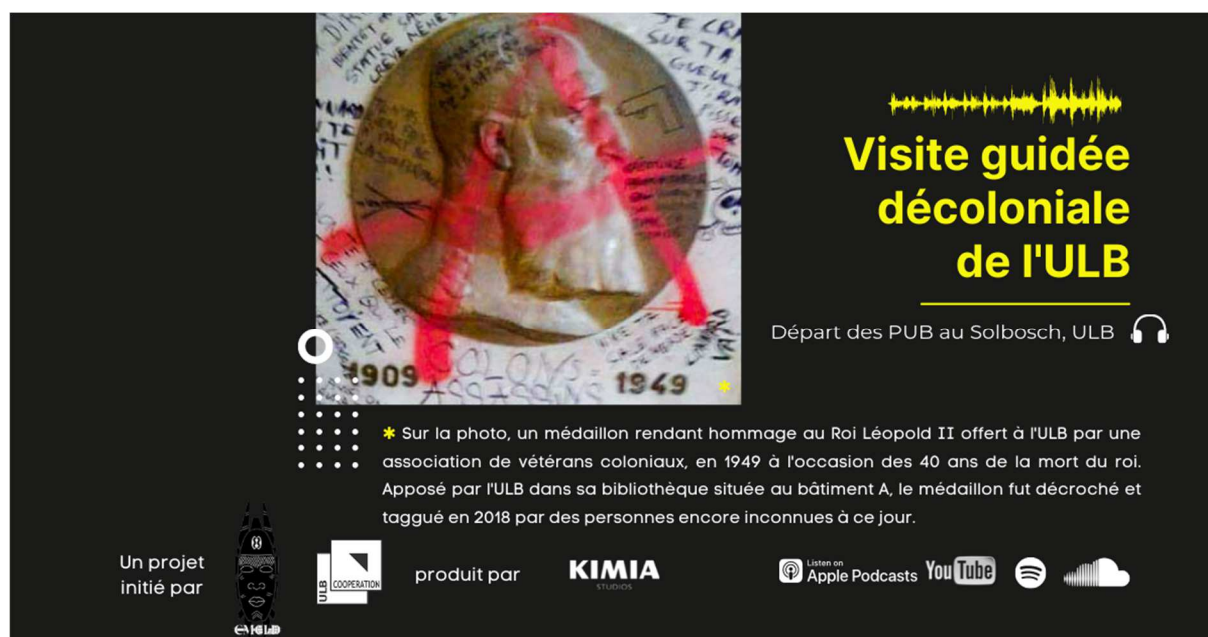
Ill. 3. « Visite guidée décoloniale de l'ULB dans le cadre du projet Décolonisons-nous » (octobre 2021).