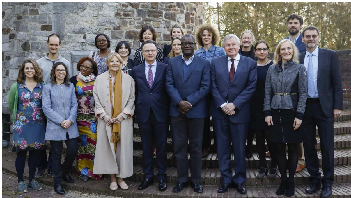
Ill. 2. Le premier congrès international de la chaire Mukwege prévu à Liège en novembre 2019